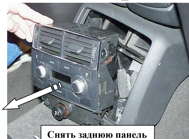
Снять заднюю панель