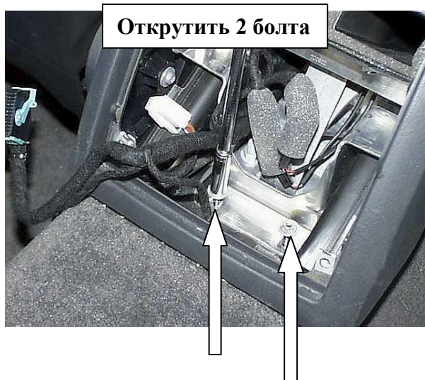
Открутить 2 болта