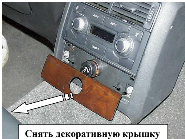
Снять декоративную крышку