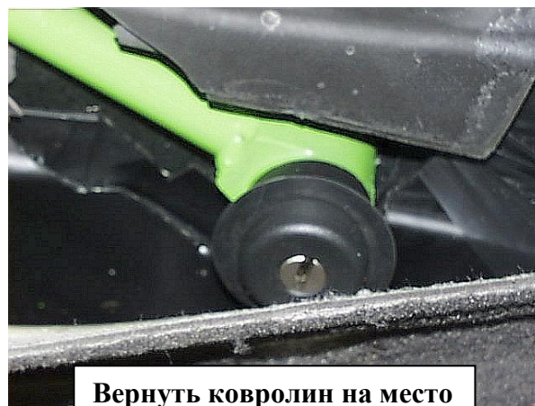
Вернуть ковролин на место