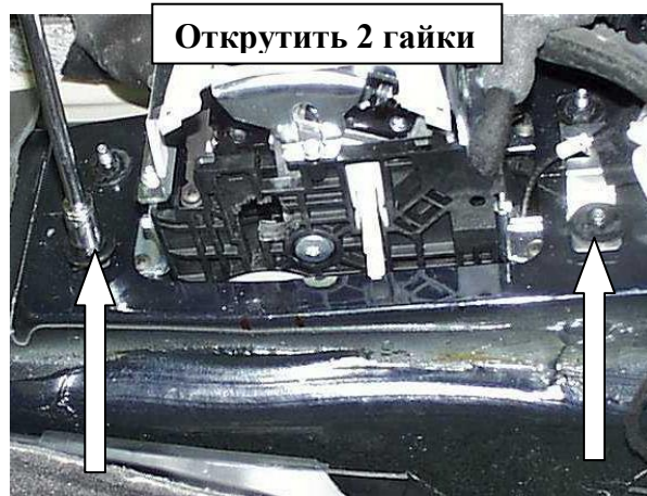
Открутить 2 гайки