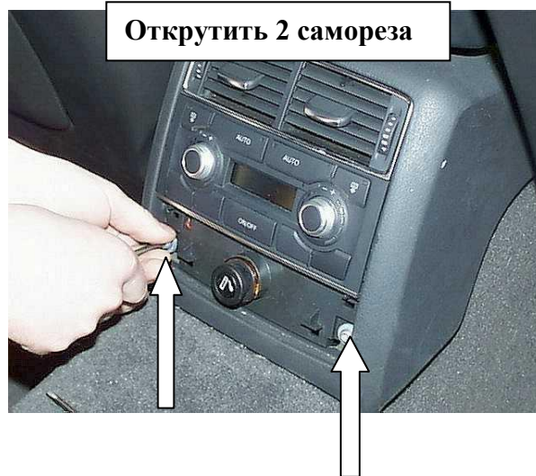
Открутить 2 самореза