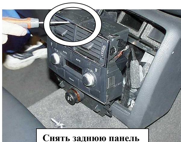
Снять заднюю панель