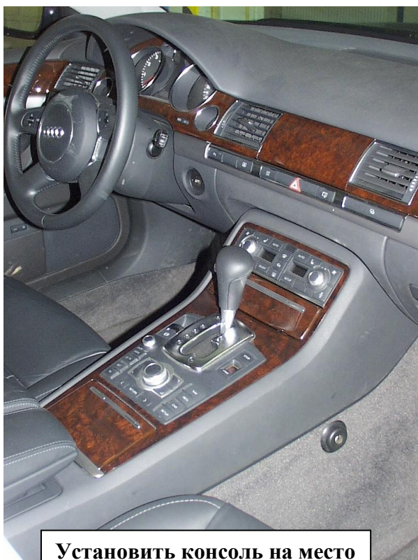
Установить консоль на место