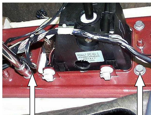
Открутить 2 болта