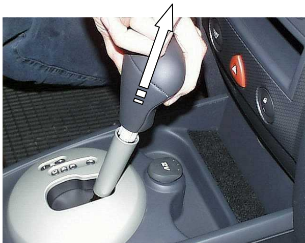
Снять рукоятку рычага переключения передач