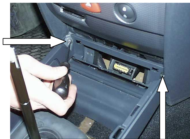
Открутить 2 самореза