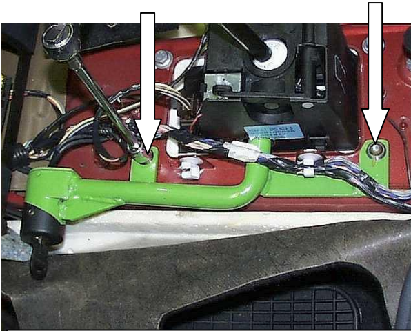
Установить замок, закрутить 2 болта