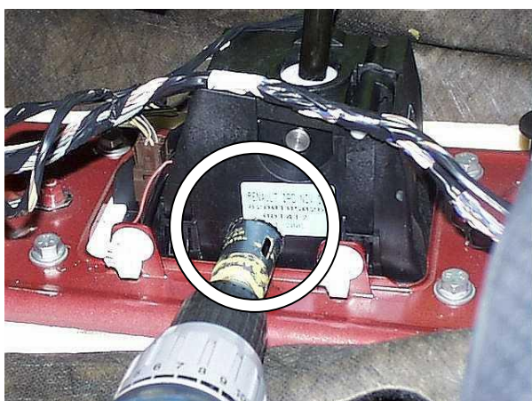
Просверлить отверстие в селекторе под трубу замка