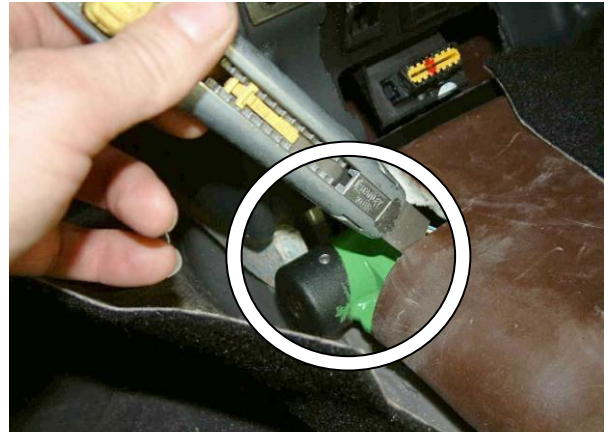
Установить звукоизоляционный кожух на место, вырезать отверстие под корпус замка