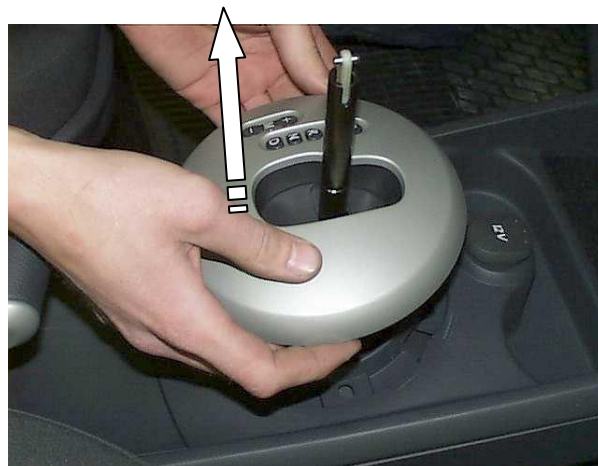
Снять декоративную крышку