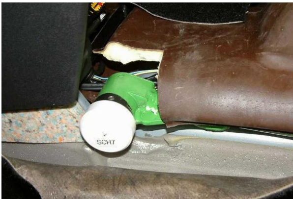
Разметить, используя разметочный шаблон, отверстие в ковровине под корпус замка