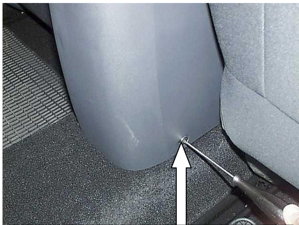
Открутить саморезы с обеих сторон