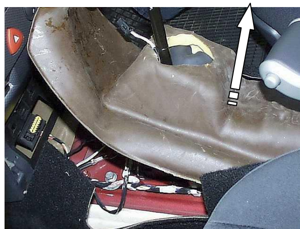
Снять звукоизоляционный кожух